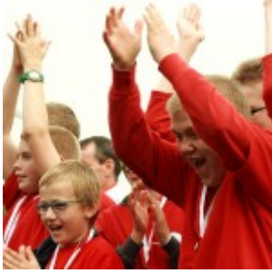
Alle sind Sieger