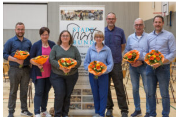
Die neugewählten SSB-Präsidiumsmitglieder.

Beim Stadtsportbund Osnabrück wird es zukünftig ein ehrenamtliches Präsidium und einen Vorstand mit einem hauptamtlichen Vorsitzenden geben. Dies hat der 66. ordentliche Stadtsporttag beschlossen.